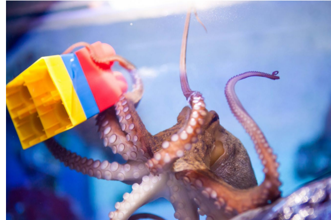
Un pop jugant amb una joguina a la seva peixera.

En un aquari dels Estats Units, un pop anomenat Sammy es divertia jugant amb una pilota de plàstic que es podia obrir en dues meitats. El seu cuidador posava menjar dins de la pilota i el Sammy l'obria, agafava el menjar i tornava a tancar la pilota quan havia acabat.